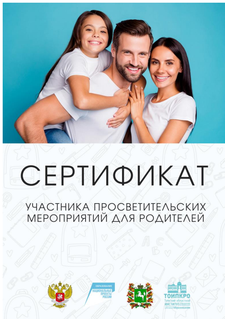
Вид сертификата участника просветительских мероприятий

8.4. Приказ о завершении дистанционного мероприятия формируется не позднее шести дней после завершения мероприятия и включает в себя электронные почты участников, имеющих личные кабинеты на сайте https://roditeli.tomedu.ru/ и получивших электронные сертификаты в своих личных кабинетах.