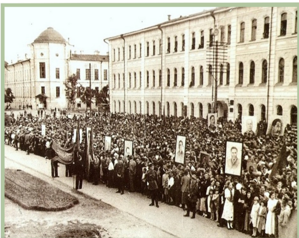
Митинг горожан после известия о начале Великой Отечественной войны 22 июня 1941 года

Но к чувствам людей примешивается в мае грусть, какая-то светлая скорбь по печальной памяти о Великой Отечественной войне. Это - 9 Мая, День Победы. Время, когда каждый взрослый в нашей стране вспоминает о своих, семейных, потерях в те трагические годы. Прошло уже немало лет с тех страшных событий. Однако память об таком кровавом испытании народа жива, она существует на каком-то генетическом уровне: ведь большинство из нас никогда не видели своих прадедов - воинов, не переживали бомбежек и обстрелов, и даже голода не застали.