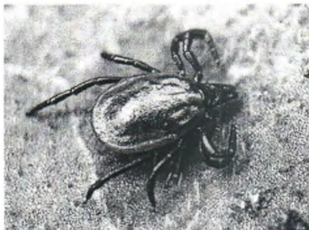
Таежный клещ рода Ixodes

На сегодняшний день клещевые инфекции стали проблемой крупных населенных пунктов. В Томской области это касается, прежде всего, территории г. Томска и его рекреационной зоны, где обитает два плохо отличимых друг от друга вида иксодовых клещей ( Ixodes ): таежный и клещ Павловского. В последние годы возросла численность ещё один клеща – лугового, принадлежащего к роду Dermacentor , который имеет два пика активности – весенний (май-июнь) и осенний (август-сентябрь). Ввиду экологических особенностей клещей и различий в их биологии случаи присасывания наблюдаются в несвойственных ранее местах – в парках, на придомовой территории, на спортивных и детских площадках и т.п.