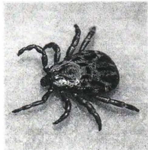
Луговой клещ рода Dermacentor

В северной подзоне области, на территории Александровского, Верхнекетского, Каргасокского районов и г. Стрежевого, где ежегодно происходит 200-300 случаев присасывания клещей, наблюдается спорадическая заболеваемость КИ (1-3 случая в год). В средней подзоне, в Бакчарском, Колпашевском, Кривошеинском, Молчановском, Парабельском, Первомайском, Тегульдетском и Чаинском районах, а также в г. Кедровый за год регистрируется от 2 500 до 3 000 случаев присасывания клещей и наблюдается низкий уровень заболеваемости КИ (2-6 случаев в год). В южной подзоне, в Асиновском, Кожевниковском, Томском и Шегарском районах риск заражения КИ наиболее высок. На долю этих районов приходится от 70 до 86 %% случаев присасывания клещей и заражений инфекциями.