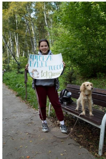
Постоялец приюта на «Мохнatom кроссе»