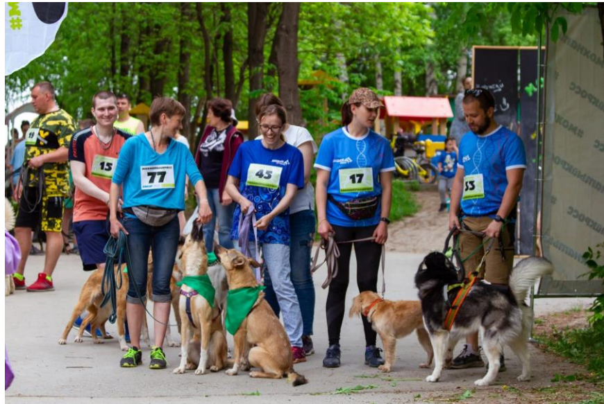
Волонтеры с бездомными животными