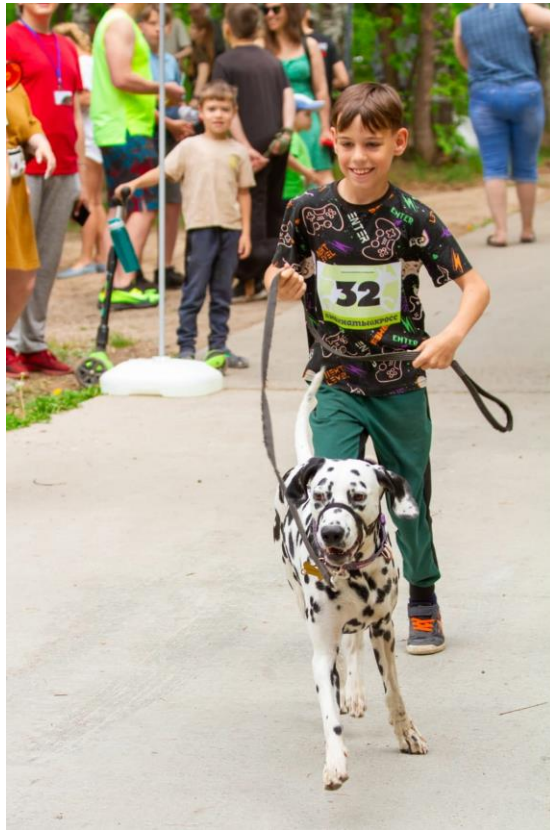
Я и моя собака Эмма на «Мохнatom кроссе»

Собак из приюта (участников кросса) потом можно забрать в семью. Но не просто забрать, а по договору с отслеживанием судьбы животного. Это делается для того, чтобы собака не оказалась на улице.