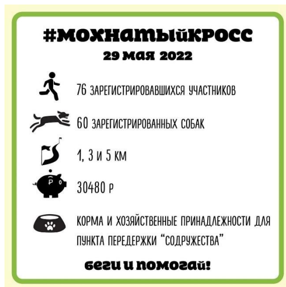
Результаты кросса 29 мая 2022

Еще, как всегда на таких мероприятиях, я участвовал в лотерее и покупал сувениры. И даже выиграл памятный приз – ручку с надписью «Мохнатый кросс».