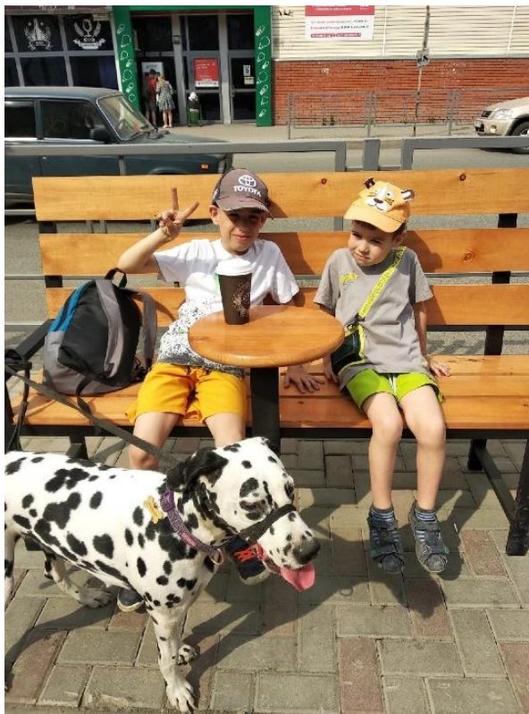
Мы на квесте возле кафе «Территория кофе»

удивленные, но это обязательно нужно делать. Каждый человек должен понимать, что животные тоже члены нашего общества, что они есть, что они бывают голодны или больны, что нельзя равнодушно проходить мимо и делать вид, что их нет, либо недовольно морщить нос. В нашем обществе нет терпимости к слабым и непохожим.