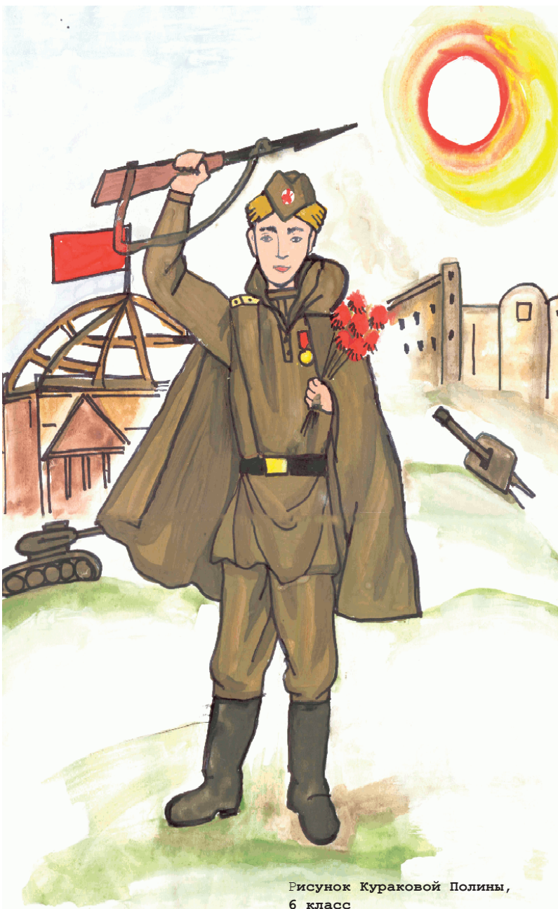
Рисунок Кураковой Полины, 6 класс