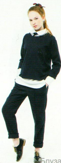
Блуза DB-101 Костюм DK-104