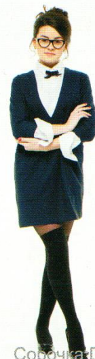
Сорочка DSAL-101 Платье DP-404