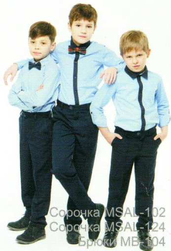
Сорочка MSAL-102 Сорочка MSAL-124 Брюки MB-104 Бабочка B-154 Бабочка B-104