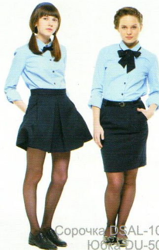
Сорочка DSAL-102 Юбка DU-504 Юбка DU-204