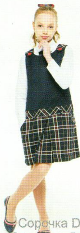
Сорочка DSAL-101 Сарафан DS-104/45 Галстук DG-154