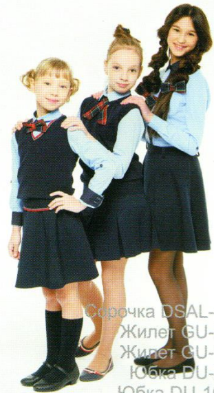
Сорочка DSAL-102 Жилет GU-245 Жилет GU-104 Юбка DU-304 Юбка DU-104P