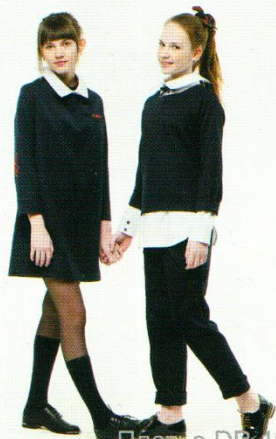
Платье DB-104 Блуза DB-101 Костюм DK-104